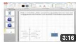
am6314 Das Koordinatensystem in