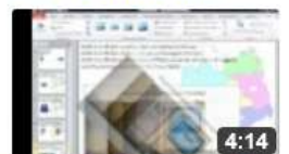
am6332 Bilder drehen, kippen, spiegeln,