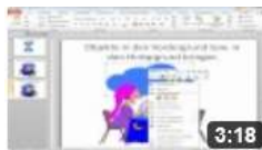
am6313 Objekte aus einer PowerPoint-