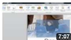
am6611 Hyperlinks zur Navigation