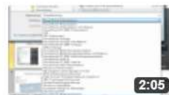
am6220 Geeignete Dateitypen für die