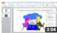
am6312 Gruppierung von