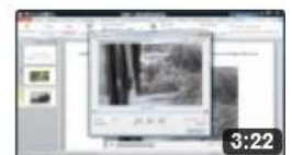
am6512 Ein Video in eine PowerPoint-