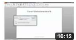
am6710 Objekte in einer Präsentation