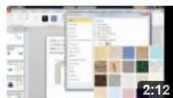
am6324 Fülleffekte bei Zeichnungsobjekten