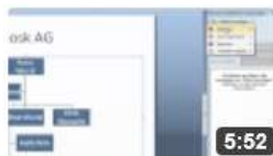
am6520 Organigramme in