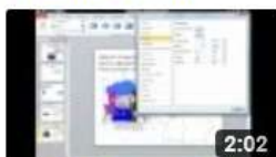
am6323 PowerPoint- Zeichnungsobjekten