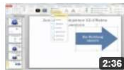
am6322 Drehung von 3D-Objekten um die