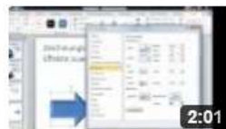
am6322 PowerPoint- Zeichnungsobjekten