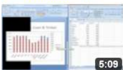
am641 Gemischte Diagrammtypen