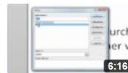
am6810 Makros in PowerPoint