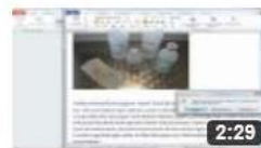
am6213 Gliederungen aus der