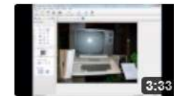
am6330 Bildbearbeitung für